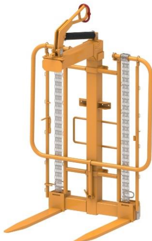
Filet de sécurité rabattable pour le transport

Présentation : Lève-palette de chantier avec anneau auto équilibré et écartement des fourches réglables équipé d'un protecteur de sécurité.