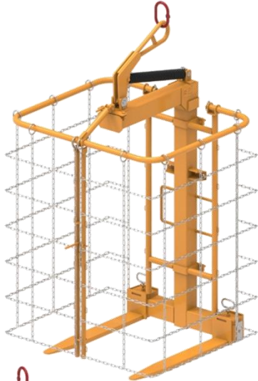
GER AU PSTR 2T