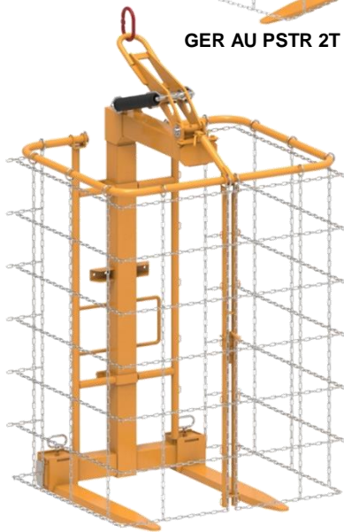
GER AU PSTR 2T+ 250